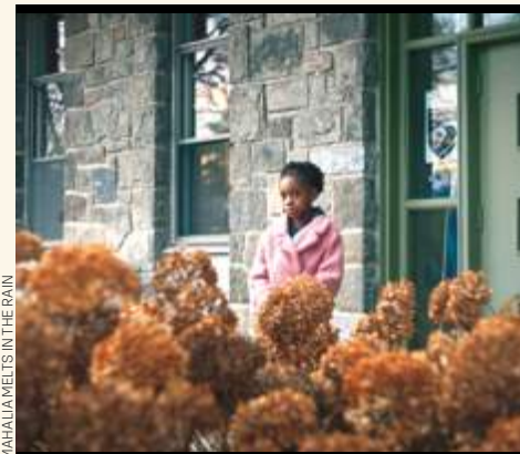
MAHALIA MELTS IN THE RAIN