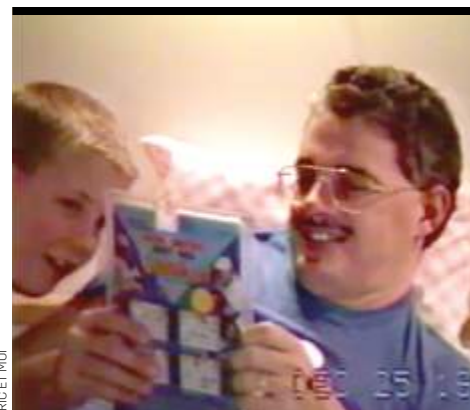
ÉRIC ET MOI