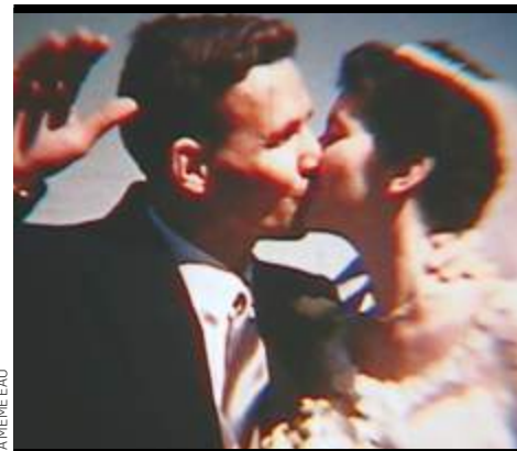
LA MÊME EAU